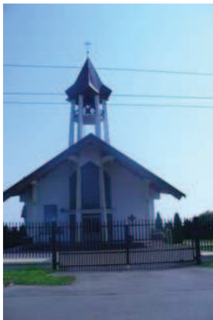
Kościół rzymsko-katolicki p.w. Św. Piotra i Pawła w Woli Rasztowskiej

uświetniający uroczystości i święta religijne. Z parafią współpracuje miejscowa szkoła głównie na polu dziedzictwa kulturowego.