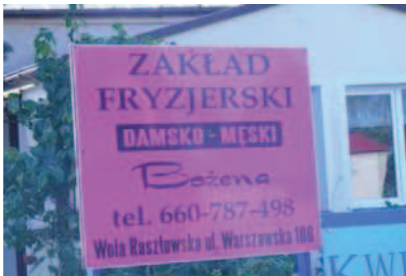
Jeden z dwóch zakładów fryzjerskich

Poza szkołą, biblioteką publiczną, świetlicą środowiskową i kościołem w Woli Raszewskiej mieści się wyremontowany w b.r. oddział Niepublicznego Zakładu Opieki Zdrowotnej, oddział pocztowy, 3 sklepy spożywczo-przemysłowe, 2 zakłady fryzjerskie, kwaciarnia, stacja gazowa, zakład kamieniarski, punkt skupu mleka, zakład krawiecki, usługi przewozowe, zakład kamieniarski i dwa zakłady mechaniki pojazdowej.