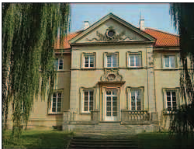
Pałac w Woli Rasztowskiej, zbudowany na wzór i na miejscu zniszczonego w czasie II Wojny Światowej pałacu z około 1680 r.

Obecnie, mimo znacznego zaniedbania park jest w dalszym ciągu wartościowym miejscem ze względu na zachowany charakter drzewostanu otaczającego pałac oraz znajdujące się tam stawy.