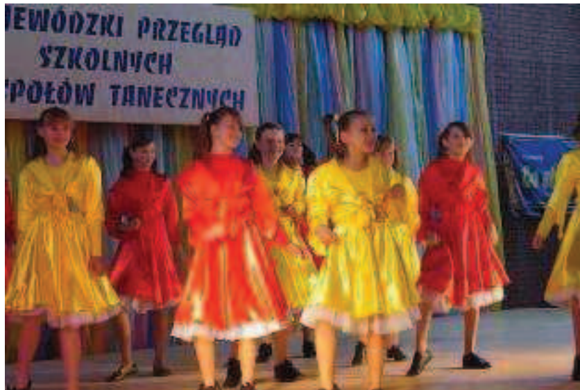
Uczniowie Szkoły Podstawowej w Woli Rasztowskiej w czasie występów

Do niedawna aktywnie działało Koło Gospodyń Wiejskich. Ze względu na zmiany środowiskowe koło działa obecnie tylko okazjonalnie.