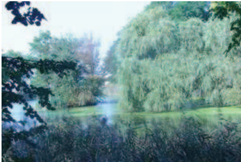
Jeden ze stawów na terenie wsi

Źródłem wody pitnej są studnie głębinowe. Woda jest złej jakości. Kanalizację stanowią szamba przydomowe. Pomimo wysokiego stopnia zgazyfikowania wsi głównym środkiem opałowym jest węgiel. Środowisko zanieczyszczają też bezmyślnie spalane śmieci i odpady oraz nieskuteczne zarządzanie ekologią przez Zakład Gospodarki Komunalnej.