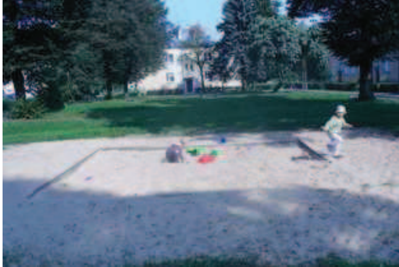
Fragment osiedla mieszkaniowego z placem zabaw

We wsi są 4 stawy, które po rewitalizacji mogłyby stać się wartościowym elementem środowiska przyrodniczego. Przy ul. Radiowej znajduje się obiekt (po zakładzie Radiofonii i Telekomunikacji) wraz z lasem, w którym żyją sarny i dziki.