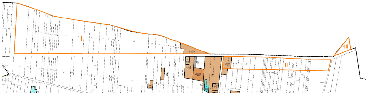
Fragment mapy gospodarczej lasu – na okres 1.01.2017-21.12.2026 r. – stan na dzień 31.07.2016 r.

Na obszarze występują niewielkie wydzielenia leśne, własności prywatnej. W części wschodniej jest to bór mieszany świeży. Występuje tu sosna w wieku 55 lat, miejscami brzoza i akacja (zadrzewienie 0,8, bonitacja IA). Na południe od drogi nr 636 jest to bór świeży. Występuje tu sosna w wieku 50 lat, miejscami brzoza i akacja (zadrzewienie 0,8, bonitacja IA).