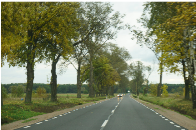
Roślinność wzdłuż drogi nr 636

Droga po obu stronach posiada rowy odwadniające. Wzdłuż drogi nr 636 rosną, tworzące miejscami szpalery, brzozy ( Betula pendula ) i topole osiki ( Populus tremula ).