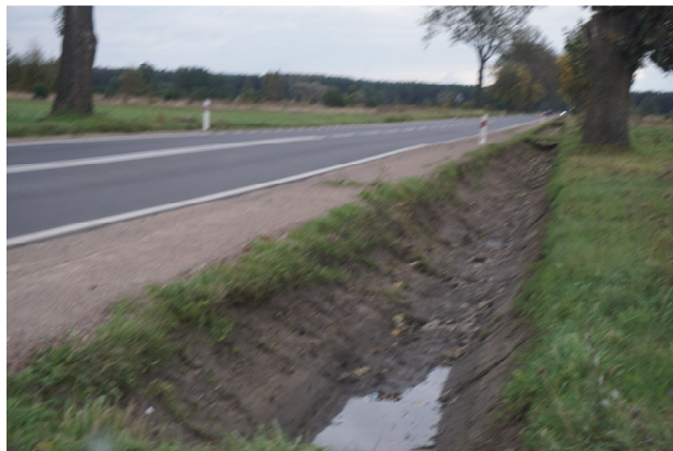
Rowy odwadniające wzdłuż drogi nr 636