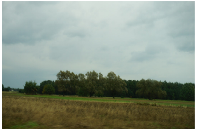
Tereny rolne na południe od drogi 636