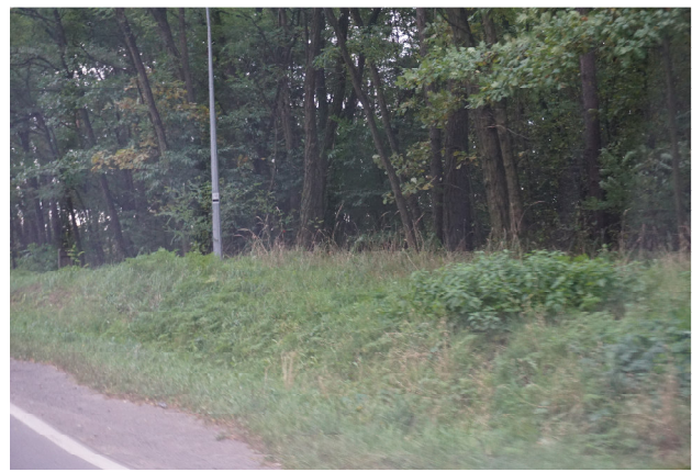
Lasy sosnowe na południe od drogi 636

Lasy te zgodnie ze Studium pozostają terenami leśnymi, tak więc nie będzie konieczności zmiany przeznaczenia na cele nieleśne, chyba że wystąpi konieczność poszerzenia dróg.