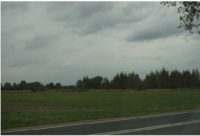
Tereny rolne na północ od drogi 636