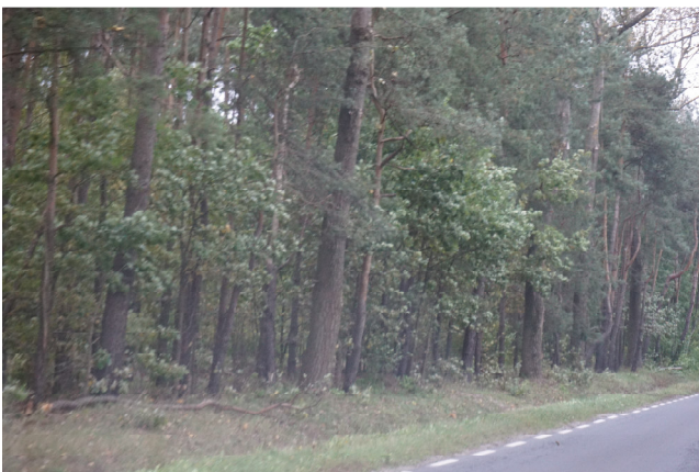
Lasy sosnowe na północ od drogi 636