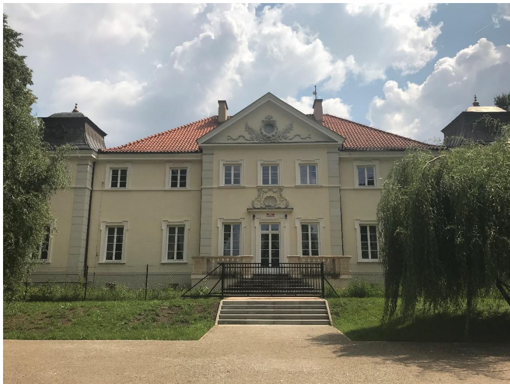
Fotografia 1. Pałac w Woli Rasztowskiej od strony parku

wyspę. Zachował się ślad dawnej alei prowadzącej do podwórzka i na pola. Obecnie na dawnym podwórzku stoją bloki mieszkalne. W ostatnich latach przeprowadzono remonty piwnic i rewitalizację parku.