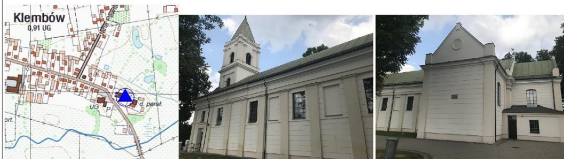
Rysunek 1. Wzór karty Gminnej Ewidencji Zabytków gminy Klembów