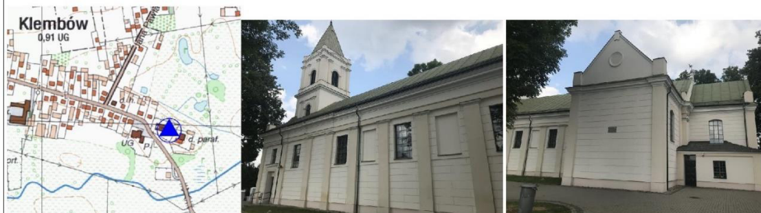
Rysunek 1. Wzór karty Gminnej Ewidencji Zabytków gminy Klembów